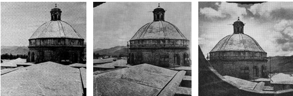
Figura 21 (izquierda): "Cuzco, La Compañía, Dome". Figuras 22 (centro) y 23 (derecha): "Iglesia de la Compañía de Jesús: bóveda y cúpula".