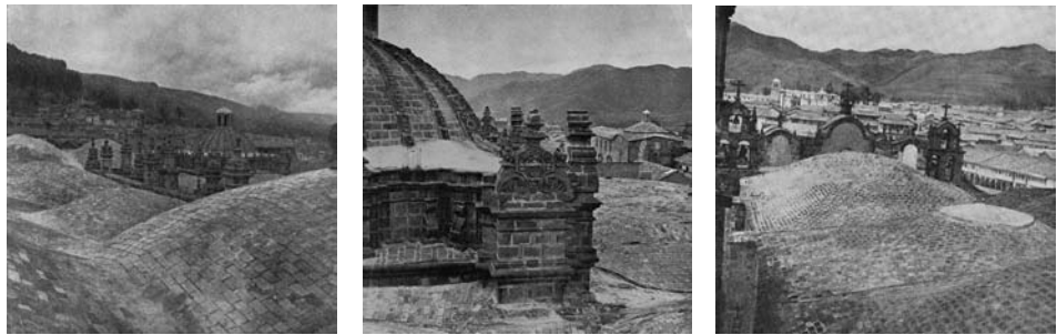
Figura 18 (izquierda): "Iglesia del Triunfo: cúpula vista desde las bóvedas de la Catedral". Fuente: Tedeschi, E., La Plaza de Armas del Cuzco . San Miguel de Tucumán: Universidad Nacional de Tucumán, 1961, lámina 17, fotografía 36. Figura 19 (centro): "Iglesia del Triunfo: detalle de la cúpula". Fuente: ídem, lámina 17, fotografía 37. Figura 20 (derecha): "Iglesia de la Sagrada Familia: exterior de las bóvedas". Fuente: ídem, lámina 18, fotografía 48.