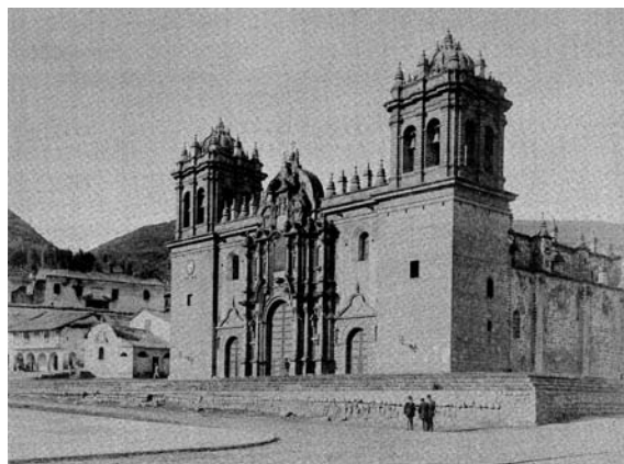
Figura 8: "Cuzco. Cathedral. Exterior".