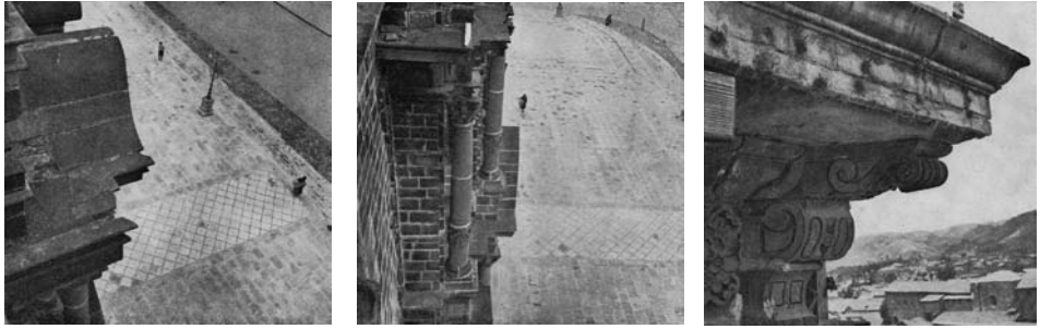
Figura 15 (izquierda): "Iglesia Catedral: detalle de la cornisa". Figura 16 (centro): "Iglesia Catedral: detalle de la cornisa". Figura 17 (derecha): "Iglesia de la Compañía de Jesús: detalle de la cornisa".