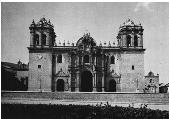
Figura 6: "Cuzco. La Catedral".