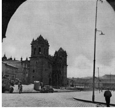
Figura 9 (izquierda): "An old defended palace on Malta", 1957. Figura 10 (derecha): "Iglesia Catedral".