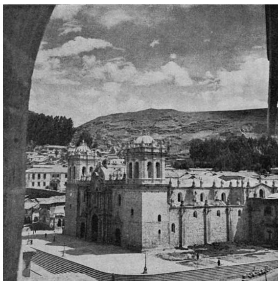
Figura 7: "Iglesia Catedral vista desde la Iglesia de la Compañía de Jesús". Fuente: Tedeschi, E., La Plaza de Armas del Cuzco . San Miguel de Tucumán: Universidad Nacional de Tucumán, 1961, lámina 13, fotografía 4.