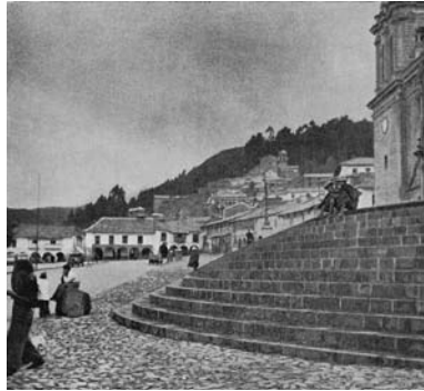
Figura 11 (izquierda): "Towpath". Fuente: De Maré, E., "The Thames as a Linear National Park", The Architectural Review , vol. 108, julio de 1950, p. 45. Figura 12 (derecha): "Escalinata de la Catedral". Fuente: Tedeschi, E., La Plaza de Armas del Cuzco . San Miguel de Tucumán: Universidad Nacional de Tucumán, 1961, lámina 14, fotografía 1.