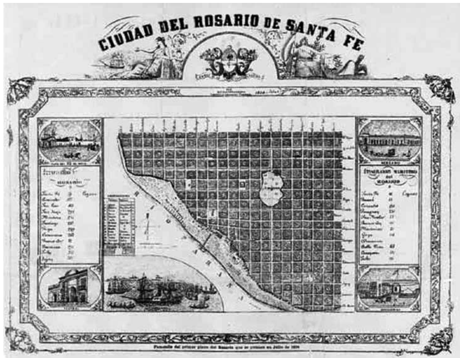
Figura 2: Grondona (1858). Ciudad del Rosario de Santa Fe .