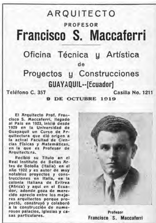
Figura 3: Anuncio de la Oficina Técnica y Artística de Proyectos y Construcciones.