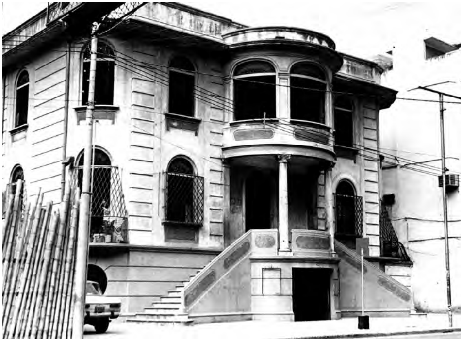
Figura 6: Casa Lisimaco Guzmán Aspiazu. Luque y Boyacá, Guayaquil (1935). Fotografía (1982).