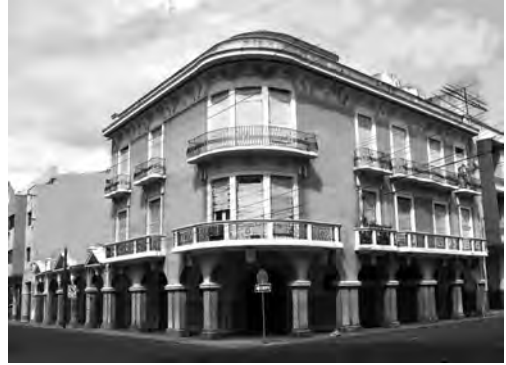
Figura 4: Edificio Marcos Plaza, Boyacá 1002 y Víctor Manuel Rendón, Guayaquil (1927). Fotografía (2017).