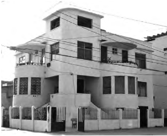
Figura 10: Casa Giovanni Parodi, Chile 500 y García Goyena, Guayaquil (1938). Fotografía (2011).