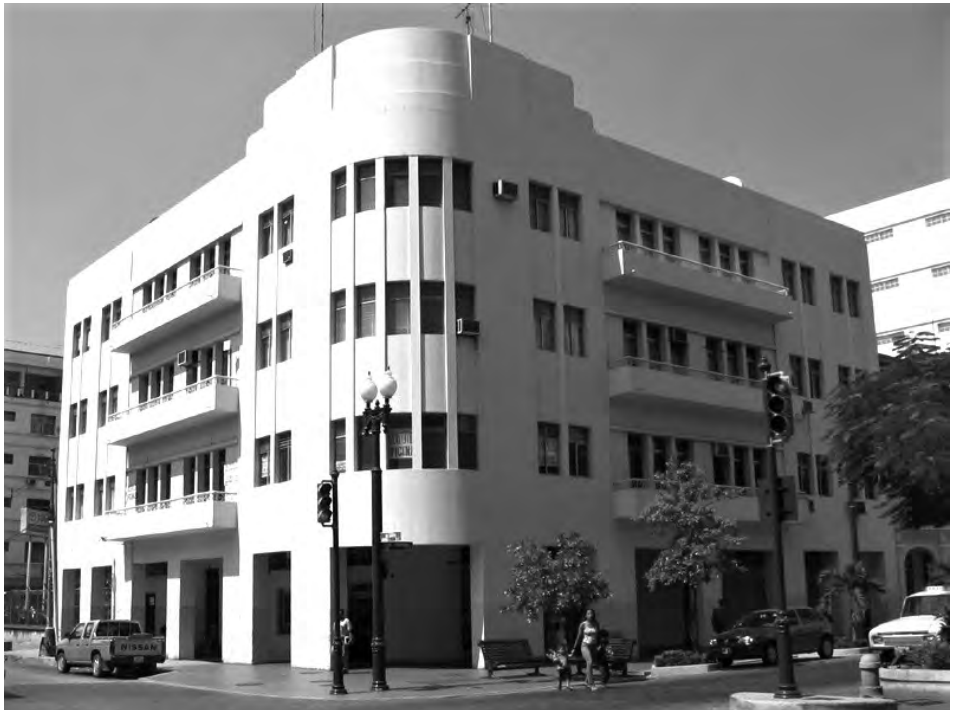
Figura 11: Edificio Vincenzo Andretta, Nueve de Octubre y Avenida del Ejército, Guayaquil (1939). Fotografía (2011).