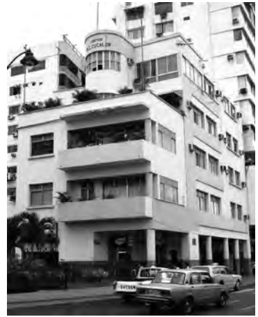
Figura 12: Edificio M. E. Cucalón, Malecón y Villamil, Guayaquil (1940). Fotografía (2018).