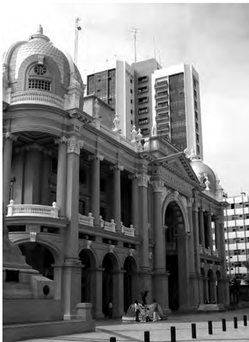
Figura 2: Palacio Municipal de Guayaquil, manzana delimitada por la Av. Malecón Simón Bolívar y las calles Diez de Agosto, Pichincha y Clemente Ballén (1923-1929). Fotografía (2017).