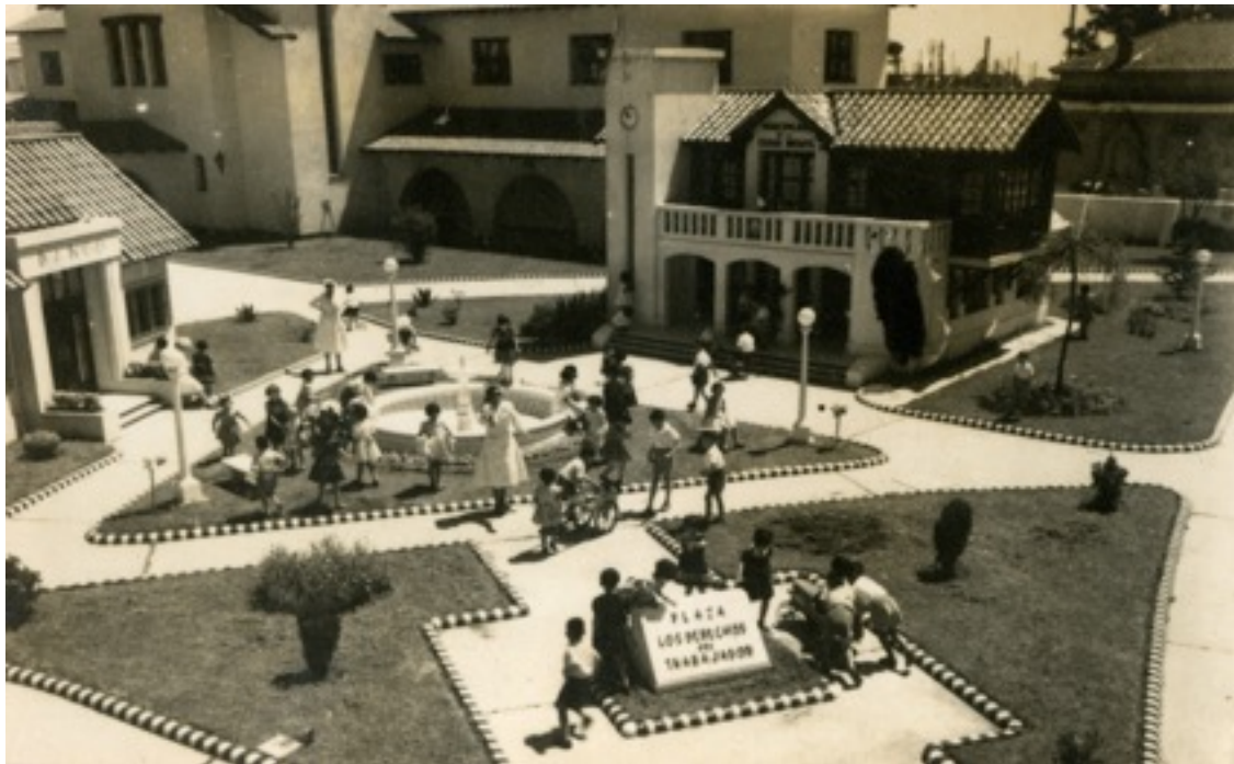
Figura 4: Ciudad Infantil Buenos Aires, Fundación Eva Perón, Servicio Internacional Publicaciones Argentina (SIPA), s/f – AGN.

En ese sentido, es preciso decir que la elección estilística no fue un hecho fortuito, sino que fue una decisión política. Todos los edificios de la Fundación introdujeron la belleza como una cuestión estructural, y no como un agregado o de manera complementaria, sino a modo de resignificación de la arquitectura social que el Estado o una institución de ayuda social debía llevar a cabo. En ellos “lo bello” se incorporó como variable principal a la hora de proyectar o adquirir los inmuebles deseados. Lo interesante del fenómeno producido por la FEP fue que el cambio social que se propuso a través de sus acciones fue recurrir a elementos culturales de otras clases sociales, es decir no configuró una nueva cultura, sino que se apropió de elementos de otra preexistente.