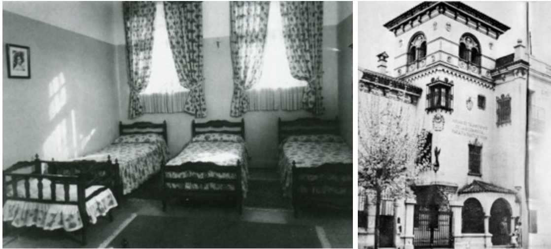
Figuras 2 y 3: Fotografía interior de Hogar de tránsito n° 1, s/f y fotografía fachada de Hogar de tránsito n° 2, s/f

En ese sentido, otra de las lecturas es posible es la interpretación de la problemática social de la desigualdad, fundamentalmente habitacional, la cual cobró escala urbana a partir de sus recorridos por las diversas regiones españolas. A su vez, la oportunidad de encontrarse con ministros y diversos representantes políticos a solas, fue la primera ocasión en la que, en nombre del gobierno de Perón, ella funcionó como actor político de peso específico e independiente.