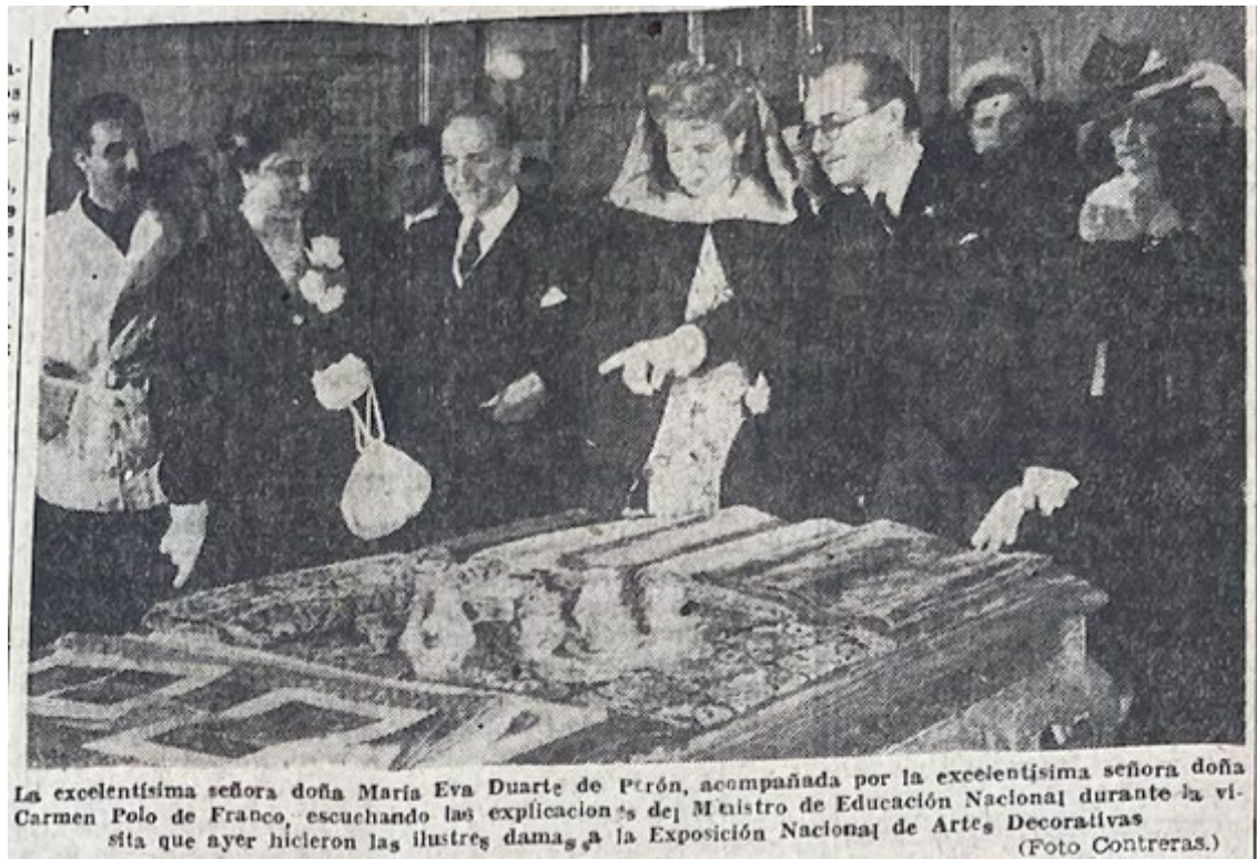
Figura 12: Imagen que acompaña nota en diario "Arriba" de Madrid, edición del viernes 13 de junio de 1947.

Sevilla, barrio de la Macarena en Sevilla, Colegio San Jerónimo de Compostela, Pueblo Español en Barcelona, y vecindario del Prat Llobregat en Barcelona. Vale la pena aclarar que el Pueblo Español es considerado por parte nuestra como un potencial edificio de interés social dada su similitud estética con lo desarrollado en la República de los Niños, a pesar de que su función social no haya sido tal en España.