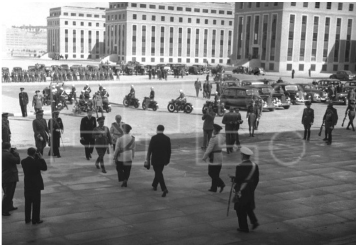
Figura 16: Edificios de la Ciudad Universitaria de Madrid, 12/10/1945.