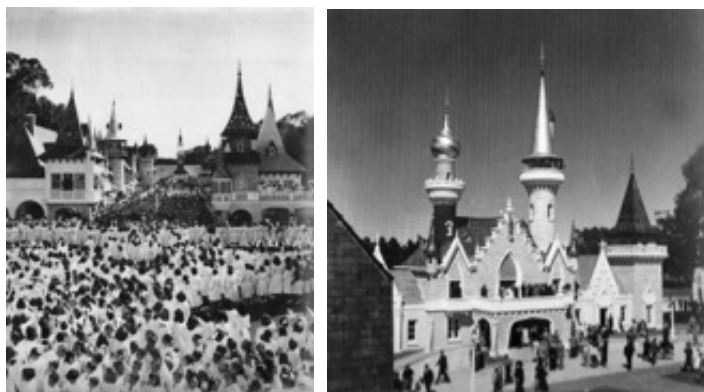
Figuras 6 y 7: República de los niños, s/f – AGN.