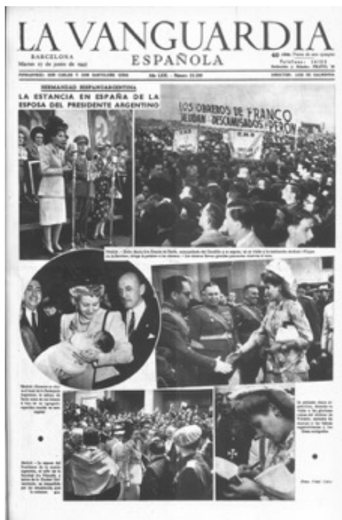
Figura 11: Tapa del diario "La Vanguardia Española" de Barcelona, edición del martes 17 de junio de 1947.

Asimismo, el análisis de las publicaciones periódicas nos posibilitó dos cuestiones. En primer término, corroborar las presuntas visitas sociales que sospechábamos había realizado Duarte en España: el Frente de Juventudes de Madrid, el Campamento Nacional Monasterio de Madrid, el Hogar del Auxilio Social en el barrio de la Ciudad Lineal de Madrid, la Escuela de Capacitación Profesional de Madrid, la Institución sindical "Virgen de la Paloma" en Madrid, la Ciudad Universitaria de Madrid, la Casa de las Flores y viviendas protegidas "Virgen del Pilar" en Madrid, la Finca Torre Pava y la fábrica de tabacos en Sevilla, la explanada de la residencia de estudiantes en Santiago de Compostela, la Casa del Pescador y la escuela para huérfanos en Vigo, y "barrios carenciados" de la periferia de Barcelona.