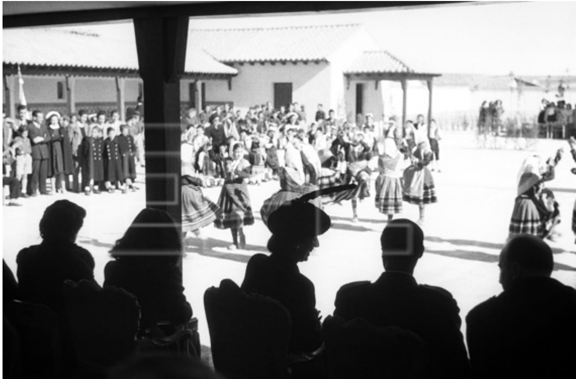
Figura 15: Fotografía del Hogar-Escuela de Auxilio Social de Paracuellos del Jarama, 4 de noviembre de 1947.