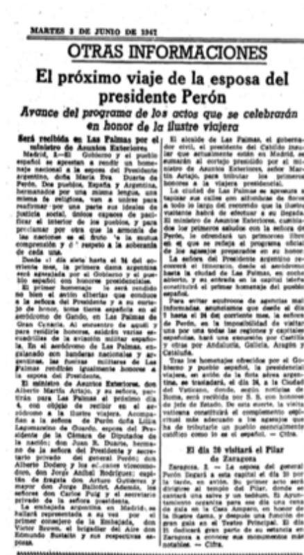
Figura 10: Nota del diario "La Vanguardia de España" del 3 de junio de 1947, donde presentan a Duarte como una "ilustre viajera", referencia recurrente en los diversos artículos que hemos relevado.

Además, hemos tenido acceso a algunas otras publicaciones sobre este viaje, las cuales, dado su contenido, son desarrollados en el anteuúltimo apartado de este trabajo.