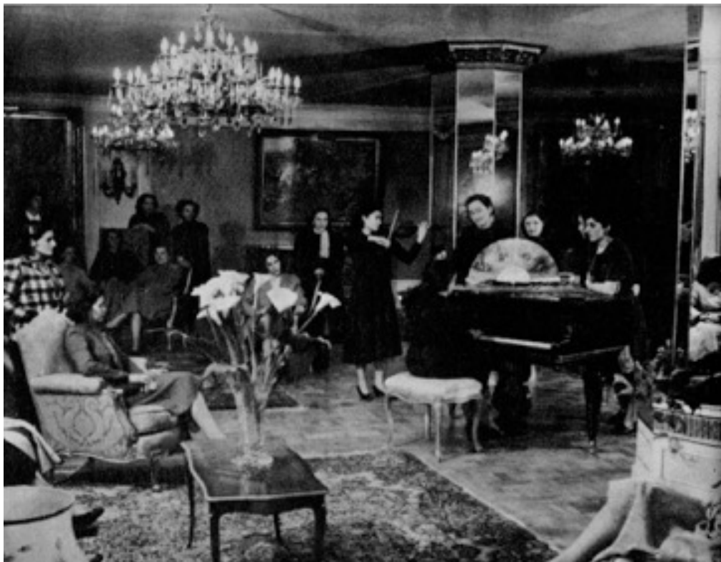
Figura 5: Hogar de la empleada. Buenos Aires, Fundación Eva Perón, Servicio Internacional Publicaciones Argentina (SIPA), s/f – INIHEP.

El sistema estético, por ende, que desarrolla la Fundación desde sus edificios tuvo como finalidad la elevación de aquellos más desposeídos (Barrancos, 2008) y de brindarles a todos los habitantes del país el acceso o el derecho a la belleza. Ese derecho a la belleza tiene un componente arquitectónico y a su vez, una componente urbana.