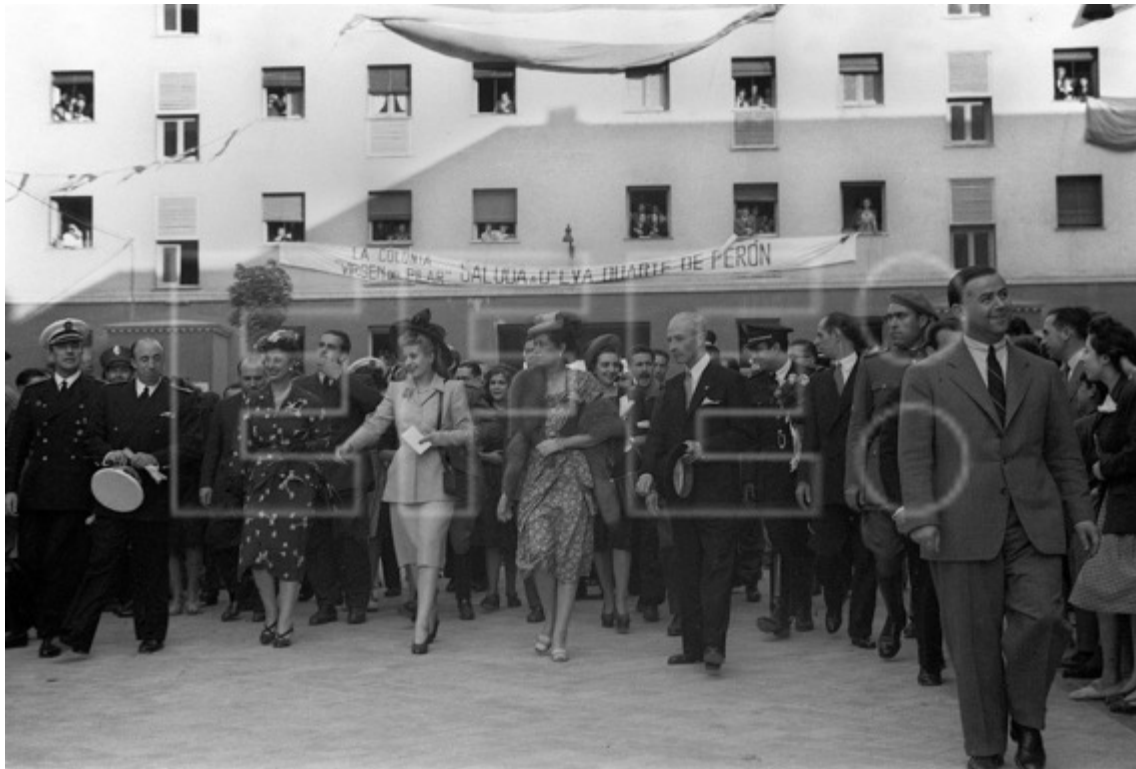
Figura 13: Duarte de visita la colonia de viviendas "Virgen del Pilar", en compañía de Carmen Polo y el ministro de Trabajo, José Antonio Girón de Velasco, el 14 de junio de 1947.

Tal como sospechábamos, el recorrido social de Duarte no fue meras “escapaditas” de las visitas oficiales, sino que, dada su magnitud durante el viaje, podemos presuponer que constituyeron un interés particular de ella.