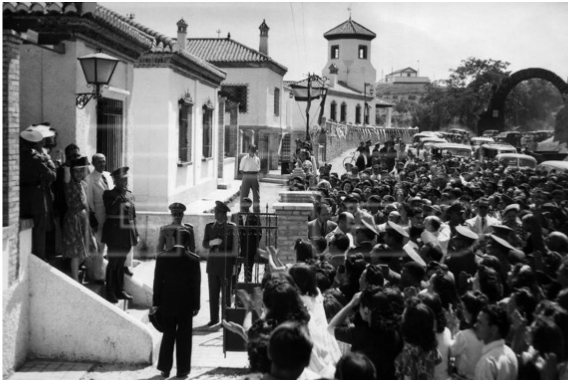
Figura 14: Duarte inaugura la barriada para los obreros de la fábrica de pólvora de El Fargue, durante la visita que realiza a España, el 16 de junio de 1947.

relato político e histórico riguroso. Estas visitas a edificios social existieron, y podemos llegar a ellas debido a que la prensa la siguió en todos sus recorridos, dejando un registro de ello. Los relatos y las historizaciones que luego se hicieron sobre el viaje decidieron qué contar y qué no.