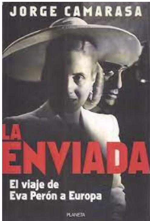
Figura 8: Tapa de "La enviada" de Jorge Camarasa, publicado en 1998.

Al igual que en el caso de Dujovne Ortiz, a pesar de ser un texto histórico, el recurso de la ficcionalización es recurrente, “reconstruyendo” supuestas conversaciones tanto de la propia Duarte como de Franco, así como también valoraciones sobre la personalidad o características personales: