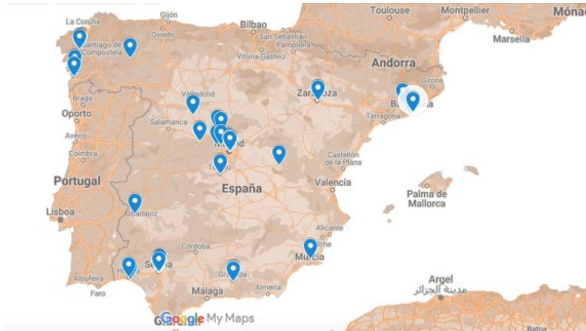
Figura17: Mapa del recorrido de Duarte en España, 1947. Elaboración propia.